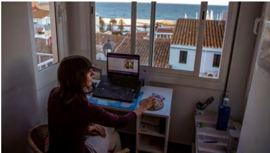
La gran mayoría de las empresas ha retornado gradualmente a las instalaciones de la empresa, con diversos grados de presencialidad y trabajo desde casa

El impacto del Covid ha reforzado la necesidad de impulsar el bienestar del empleado en un sentido que va mucho más allá de su crecimiento profesional