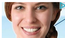
Ortodoncia estética 60% dto. Antes, 1.200€. Ahora, ¡480€! No se notan nada. Brackets zirconio 480€