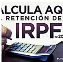
Calcula aquí la retención de IRPF para 2016