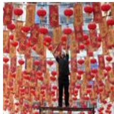
Año Nuevo Chino 2016: el año del mono en la...