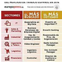
Estos son los profesionales más buscados para 2016