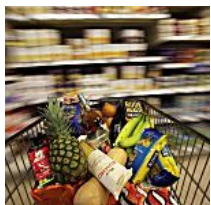
¿Qué supermercado ha encarecido más la cesta de la