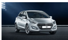
No dejes pasar las condiciones especiales que te ofrece Hyundai hasta el 15 de f... Ofertas Cinking Hyundai