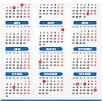
Calendario laboral 2016: Semana Santa, vacaciones