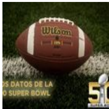
Super Bowl 2016 | Las cifras del evento