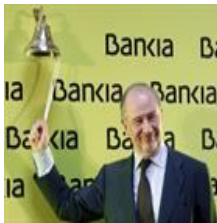
Bankia 2011: la salida a Bolsa de una entidad "al..."