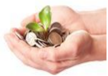
Las diez opciones de inversión que aumentarán su...