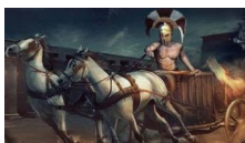
Este juego es tan adictivo que es imposible dejarlo. 100% gratis! Mejor juego del año