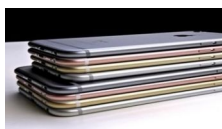
Las tiendas no quieren que descubras este curioso truco para comprar online. ¿Lo has probado?