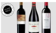
Los vinos con la mejor relación calidad/precio del mundo según Robert Parker 3 vinos españoles tienen la mejor relación calidad/precio del mundo