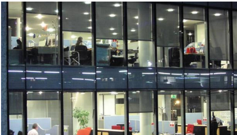
Los «nuevos empleados» basan sus decisiones en la emoción que le produce una empresa

Las organizaciones se apoyan cada vez más en las redes sociales para dar a conocer su imagen de marca como empleador o para relacionarse con nuevo talento